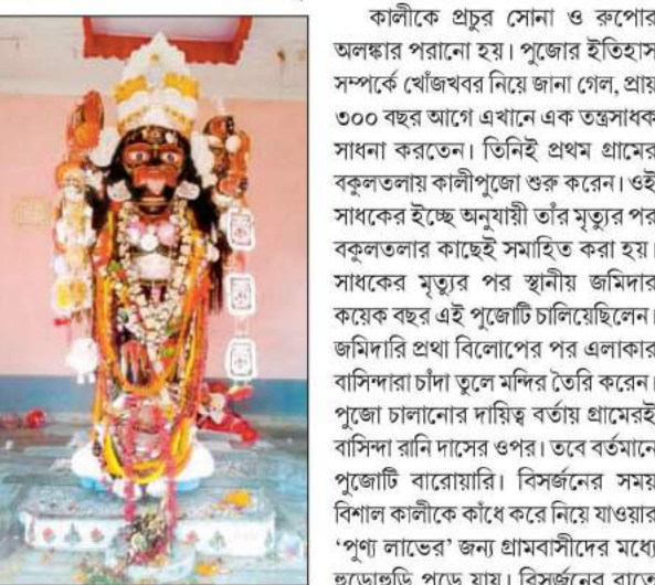
মুহুরী গ্রামের কালীপ্রতিমা।